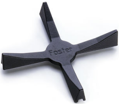
Soporte para Wok de hierro fundido 9601 668